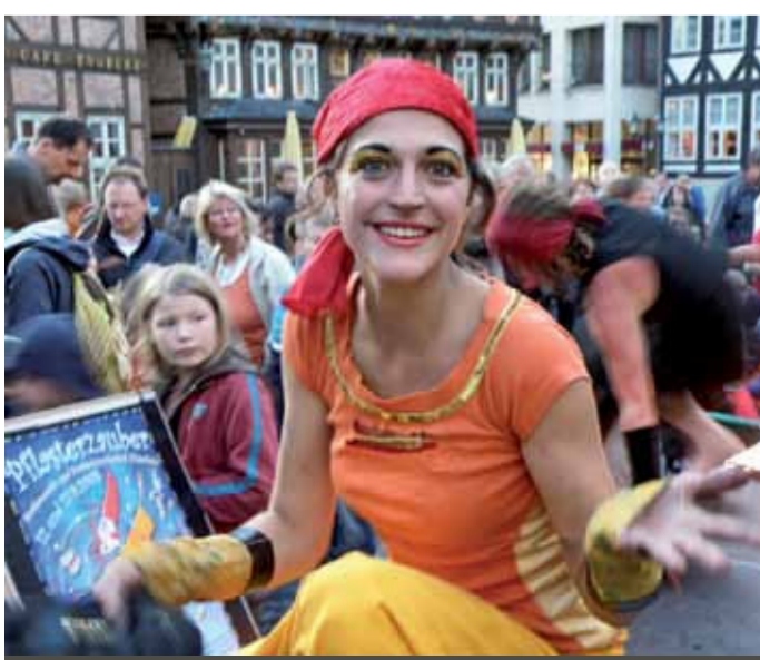
FOTO OVAN "Theater für Niedersachsen" FOTO NEDAN "Pflasterzauber" – gatukonstfestival i innerstaden

Icke minst tack vare sina 10 000 studenter har Hildesheim en rikedom i bildning och utbildning genom institutionerna UNIVERSITETET HILDESHEIM, FACKHÖGSKOLAN HILDESHEIM/HOLZMINDEN/GÖTTINGEN FÖR TILLÄMPAD VETENSKAP OCH KONST OCH NORDTYSKA FACKHÖGSKOLAN FÖR RÄTTSTILLÄMPNING . En möjlighet till livslångt lärande – i Hildesheim är det en realitet. Bildningslandskapet i Hildesheim är optimalt utrustat med alla skolformer. STUDIEFÖRBUNDET HILDESHEIM och stadens MUSIKSKOLA kompletterar utbudet.