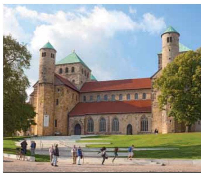
FOTO OVAN Mariadomkyrkan – UNESCO världsarv © BPH, Ina Funk FOTO NEDAN S:t Mikaelsskyrkan – UNESCO världsarv © Hildesheim Marketing, Nina Weymann-Schulz

En bro till nutiden bildar det HISTORISKA TORGET med sina imponerande korsvirkeshus. Platsen rekonstruerades så nära originalet man kan komma genom initiativ och gåvor från stadens medborgare under åren 1984 till 1990. Inne i slaktargillet hus, "KNOCHENHAUER-AMTSHAUS" bjuder stadsmuseet in till en resa genom tiden i hela staden och regionen. Sedan 2010 är det rekonstruerade historiska huset Den omvända sockertoppen, "UMGESTÜLPTE ZUCKERHUT" vid Andreasplatsen ytterligare ett smycke för staden.