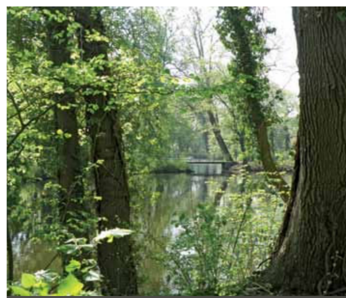
FOTO OVAN Blommande rosor i Magdalenas barockträdgård FOTO NEDAN Ernst-Ehrlicher-Parken

Hälsosamt liv skriver man i Hildesheim med stora bokstäver. Därom vittnar inte bara den yppiga naturen utan även en hälsosektor i tillväxt. HELIOS-KLINIKEN HILDESHEIM och S:T BERNWARDSJUKHUSET med intilliggande vårdcentraler och TALRIKA PRIVATPRAKTISERANDE läkare borgar för en god vård och omsorg i staden Hildesheim.