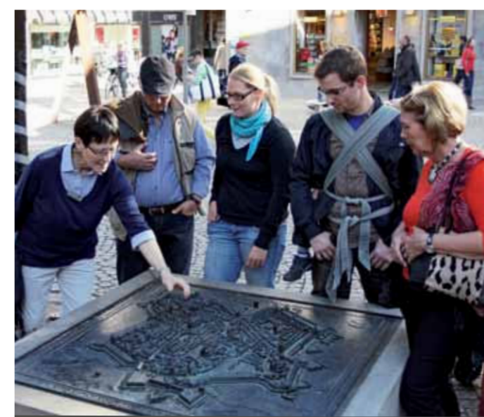
FOTO OVAN S:t Andreaskyrkans torn FOTO NEDAN Historisk stadsmodell

🚩 Samling under Rådhusarkaden vid det historiska torget. Ingen föránmälan för enkla personer eller smågrupper krävs.