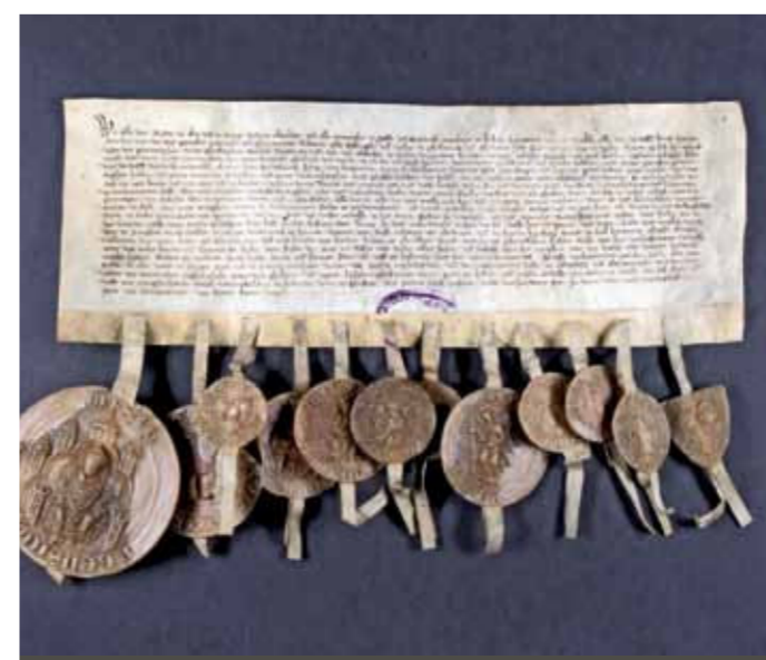
FOTO OVAN Det historiska torget FOTO NEDAN Dokumentet De sammansvarnas förbund, år 1345