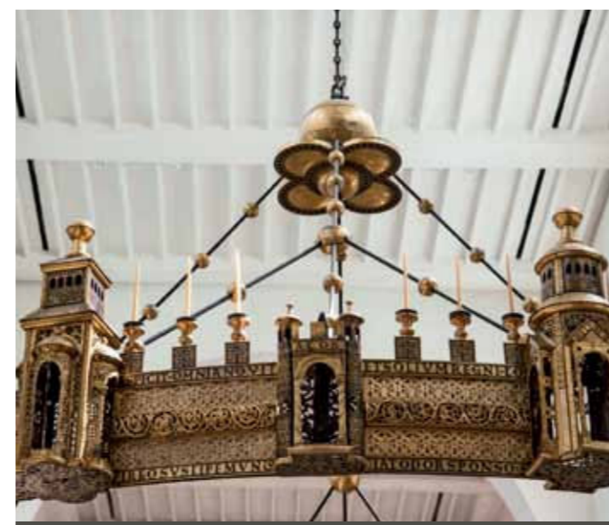
FOTO LINKSONDER Kerstmarkt van Hildesheim FOTO ONDER Hezilo-kroonluchter in de Mariadom