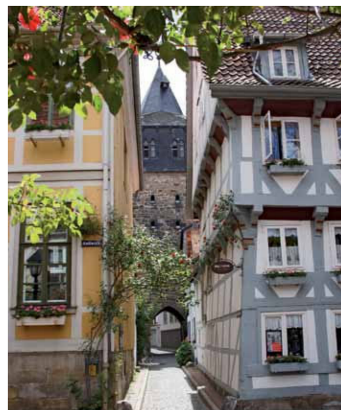
FOTO ABAJO Torre del Retorno en el barrio de Neustadt

El ICE, un tren de alta velocidad, garantiza unas rápidas conexiones domésticas. Por ejemplo, el ICE tiene conexiones directas desde Berlín, Braunschweig, Fráncfort del Meno, Gotinga Múnich y Stuttgart. Deutsche Bahn, Erixx y NordWestBahn ofrecen otras conexiones suprarregionales.