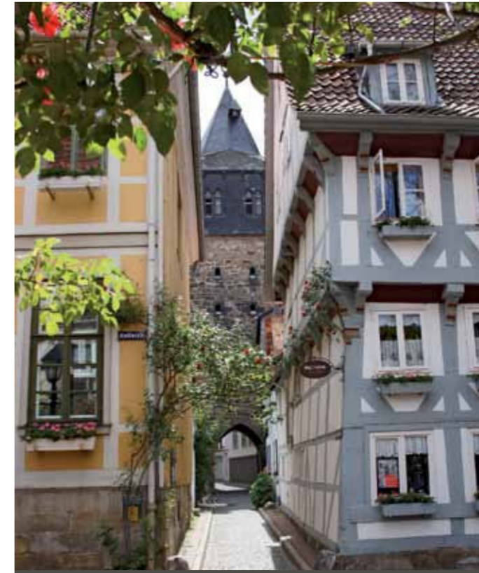
FOTO NEDENFOR Kehrriederturm i bindingsværkdistriktet

ICE-forbindelserne sikrer hurtige nationale togforbindelser. Hildesheim kan nås direkte med ICE for eksempel fra Berlin, Brunswick, Frankfurt am Main, Göttingen, München og Stuttgart. Yderligere regionale togforbindelser kan opnås med "Deutsche Bahn", "Erixx" og "NordWest-Bahn".