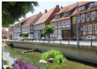
Kurstadt Bad Salzdetfurth